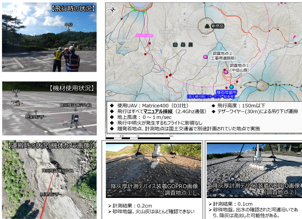
図3. 試験概要（左：調査時の状況，右上：調査箇所位置図，右下：調査地点状況）