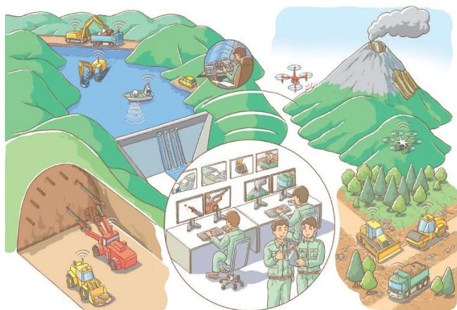
図1. 「第3期 SIP：サブ課題A：革新的な建設生産プロセスの構築」の全体構想

我々研究チームは、これまで無人航空機（以下、UAV）を活用した火山地域における無人調査技術の開発に携わっており 1) 、第3期 SIP プロジェクトにおいてもこれら技術を踏まえ、火山噴火時の立入制限区域における降灰厚等情報の迅速かつ無人での調査技術の開発ならびに社会実装を目標としている。