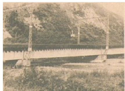
図-4 震災後13年経過した小田急線・酒匂川の鉄橋。

関東大震災以前の酒匂川上流河内川流域は森林が繁茂し河水は清澄で各所に深淵を形成していた。震災後は、川幅3mほどだった箇所が崩壊土砂で10~40mに広がり転石累々の場所となった（建設省京浜工事事務所、1968）。この急