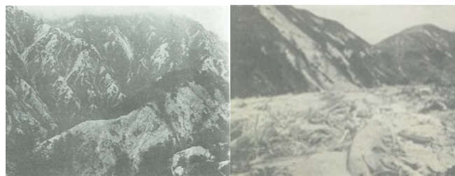
図-2 河内川上流の恩賜林の崩壊地 (神奈川県森林再生課) 図-3 河内川上流の流木堆積状況 (神奈川県森林再生課)

図-2は河内川の上流部の状況である。山のあちこちがまるで雪が降り積もったかのように見える。地震により山が崩れ樹木が無くなったからである。実際には遠方から眺めると山全体が赤茶けた地肌に見えたという記録がある。図-3は崩壊地から谷へ落ちて堆積した崩壊土砂と流木の状況であり、こうした個所が無数にでき、降雨のたびに土砂と流木が下流へと流出した。