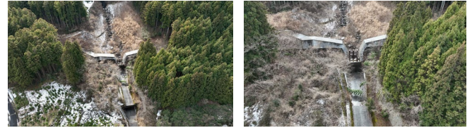
図 3 高度による撮影成果の違い (高智階段第 2 号堰堤 右：高高度、左：低高度)