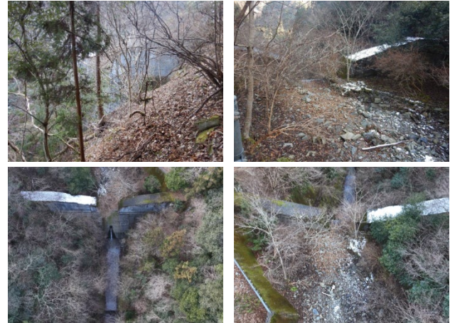
図 4 画像取得結果 (上：代替案、下：遠望点検)

トを設定することで解決可能と考えられる。また、フライトやとりまとめにかかる時間については、今後、管内に存在する多くの施設を点検する中で最適な方法を検討していく必要がある。