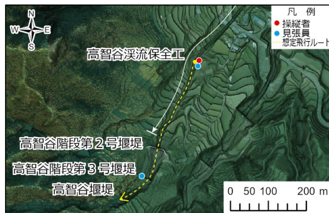
図1 高智川 試行箇所