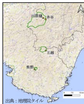
図-1 研究対象流域図

継続的な土砂移動が確認された川原樋川流域に設置されている「赤谷」及び「川原樋」の観測地点と併せて、計測期間が長く欠測等が少ない「三越」、「熊野」の 4 地区について、降雨規模とハイドロフォンで観測された掃流砂量の関係について分析を行った。