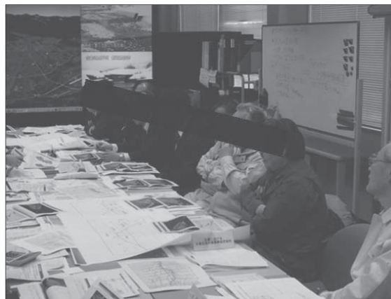
図1 緊急対策シミュレーションの実施状況

参考文献: 西村直記・亀江幸二・牧野裕至・花岡正明・佐光洋一・河合水城・近藤正樹・萩原陽一郎 (2014) 大規模土砂災害を想定した防災訓練による効果調査及び調査結果を活用した訓練方式の改善検討、平成26年度砂防学会研究発表会概要集, pp.B-160-161