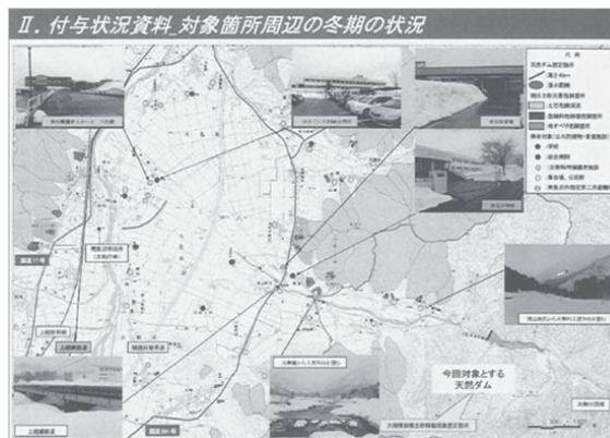
図3 対象箇所の冬期の状況の想定