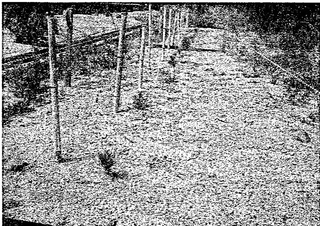
写真-1 平成12年9月14日のクロマツの生育状況 (感染+シート無)

クロマツ感染苗木植栽後7年間の経過したが、最初にヌメリイグチを感染させた苗木の菌根菌が試験区全体に広がっており、非感染クロマツの感染も確認された。これで試験区全体のクロマツがほぼ菌根菌に感染したことになる。今後、このことが耐塩性や耐乾性の向上にどのようなつながっていくかを検討していきたい。また、並行してクローネが閉鎖するまでは継続して樹高および根元成長量の調査を行い菌根菌と不織布シートを用いた海岸防災林造成のための基礎的なデータを収集したい。