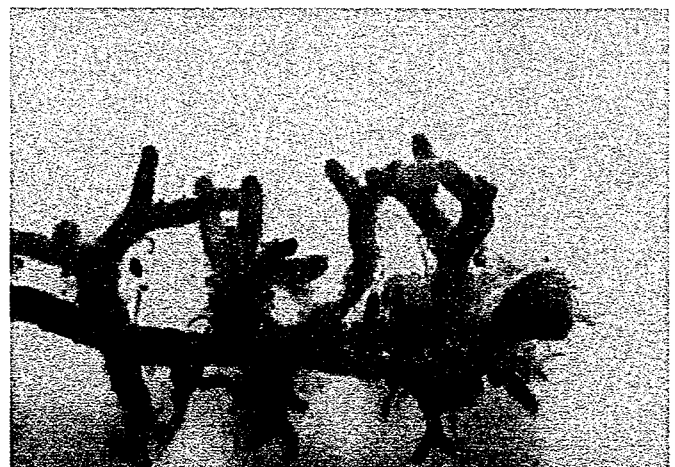
写真-4 非感染クロマツに感染した菌根の状態 (平成18年7月11日 非感染+シート無)