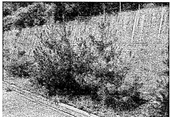
写真-2 平成18年7月11日のクロマツの生育状況 (感染+シート無)