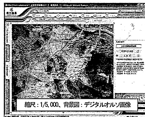
図-3 インターネット公開サイト ( http://www.sabomap.jp/kagoshima/ )