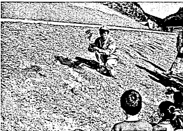
写真-3 植栽の仕方の説明