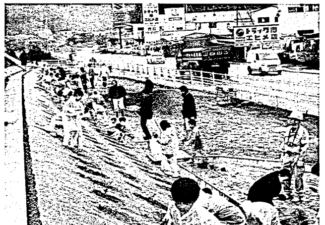
写真-4 小学生の植栽状況(平成17年度)