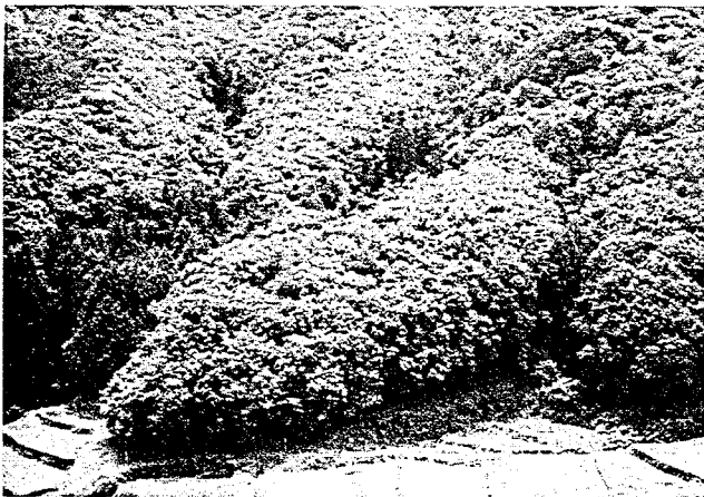
写真-1 道路開設前の山林の状況

宇和島道路では、緑化基本理念に基づき、地域生態系を最大限に配慮した緑化が着実に進行している。所期の目的を達成するためには、単純にのり面上の緑を増やせば良いというものではない。その質的な内容が大変重要となる。そのためには、緑化基本理念に基づき、永続的な調査とその結果を生かした効果的な取り扱いが大切である。最後に、本報告のとりまとめにご協力を頂いた国土交通省四国地方整備局大洲河川国道事務所、四国建設コンサルタント株式会社および苗木の育苗にご協力頂いた日本植生株式会社に深甚なる謝意を表す。