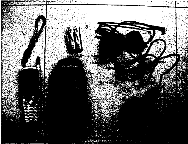
図2 MobileMapperPro (THALES 社製)