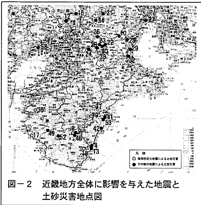
図-2 近畿地方全体に影響を与えた地震と土砂災害地点図

1854年12月24日の安政南海地震（海溝型地震）時に、和歌山県内でも多数の山崩れが発生し、甚大な被害が出ている。大阪ではその時に発生した津波の影響により木津川・安治川を逆流し、碇泊中の船舶や橋梁の破損、死者を出す甚大な被害に及んでいる。その35年後に発生した「十津川災害（台風による降雨災害）」では山間部で山崩れ等が発生し、いくつもの河道閉塞箇所が形成され一部は決壊し下流へ甚大な被害を及ぼした。また、河口付近では標高の低い箇所ですみ水被害が発生している。安政南海地震と十津川災害との因果関係は定かではないが、地震時に緩んだ地形がその後の降雨により崩壊し土砂災害へと発達する危険性は高いものと推察される。そのことから、地震直後に発生する土砂災害とその後の降雨により発生する土砂災害の2つのタイプについて、今後は対策等を検討していく必要があるものとする。参考までに、あまり知られてはいないが十津川災害と同時に反対側の流域（田辺市）でも同じような災害が発生している。