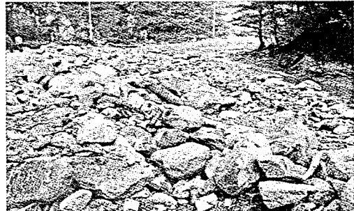
写真-2. 土石流の流出状況