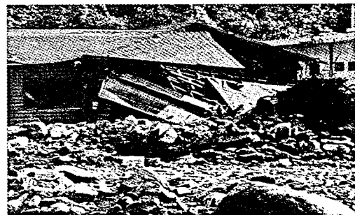
写真-4. 休養施設の破壊