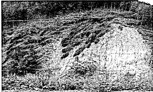
写真-1. 山崩れの発生状況

対策としては、上流にはスリットダム、スクリーンダム等の透過型砂防ダムを施工して土石流および流木を阻止すると共に、流域の上流から下流まで系統的な砂防事業を施した。なお、流域の残餘土石量を推定して流域全体を概念において砂防事業を実施した。