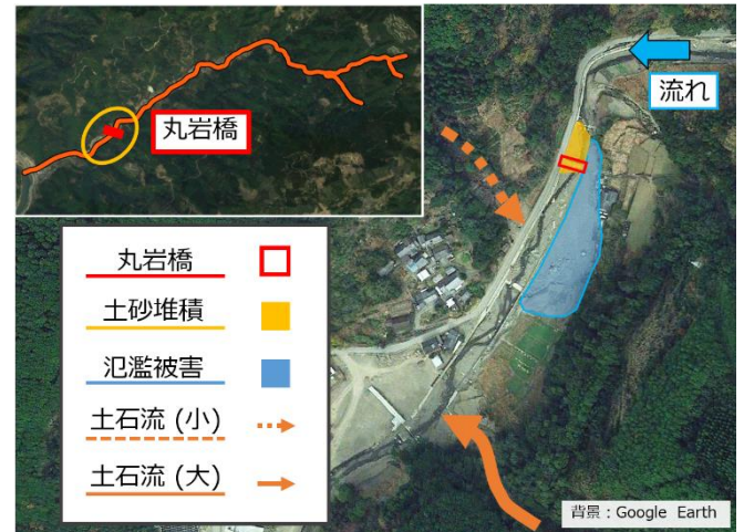
(a) 被災後の全体の様子

境界条件として、7月3日18:00~4日14:00に観測された雨量から降雨流出解析によって算出した流量ハ