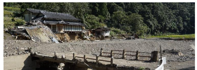
(c) 被災後の左岸側の様子