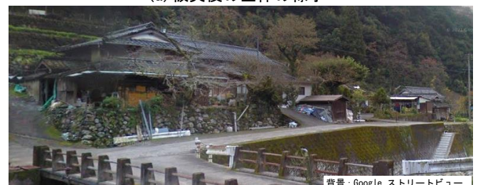
(b) 被災前の左岸側の様子