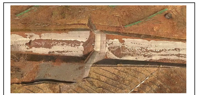
写真1 UAVによる簡易オルソ画像の生成(例)