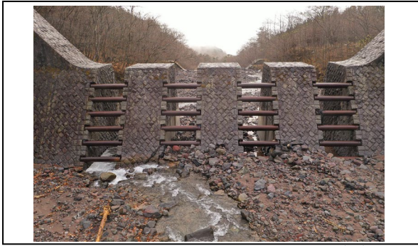
写真 2 正立面画像による変状確認(例)

できるため点検要領の基本である「目視相当」の代替方法として十分であり、仮に変状が確認されれば、点検技術者の「目視点検」により劣化状況などを補完点検することで、目視のみの点検よりも効率的な点検が UAV 点検でも可能となる。