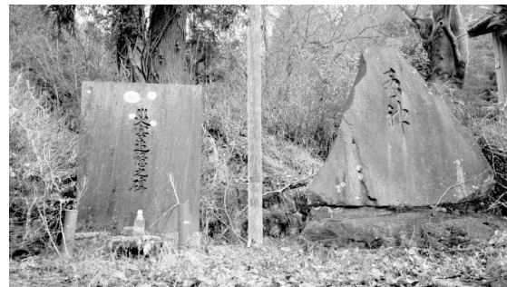
写真2 昭和47年災害の追悼碑(2014年2月撮影)

すぐに逃げ出した。母たちは裸足でとんできた。いっしょにきた赤ん坊は、驚き泣きさげんでいた。私はあまりの恐ろしさに、箸と茶わんを置くひまなく固く持ったまま、隣のうちまでとんでいった。 びやく がおさまって少したってから、私だけ家に戻ってみた。そしたら父が「手をつけられないから、消防の人を呼んできてくれ」と言った。私は家の方の道を行きたかったが、怖くて通れなかった。・・・昭和四十七年七月十二日、この日は一生の思い出になると思う。二度とこんな日は来てほしくないと祈ります。」