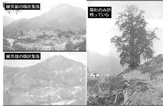
写真1 箒沢山の昭和47年災害前後の写真(三保中学校)

それからどれくらいたったかわからなかったが、ちょうど。みんなで朝ごはんを食べているときだった。台所で姉が「来た来た」と言った。父はとっさに「みんなにげろー、となりの家に行け」といった。私は運よく、靴をはいていたため、す