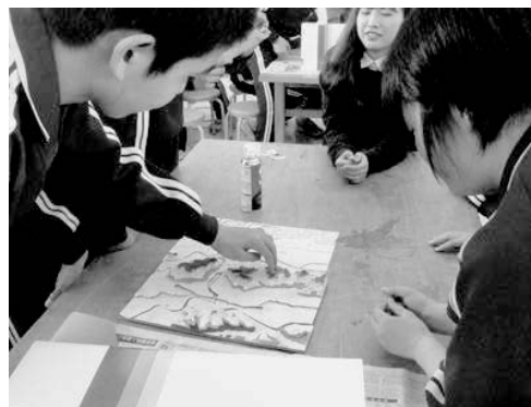
写真1 立体マップを用いた授業の様子

事前の教員へのヒアリングから、2010年7月災害の認知度は地域でもそれほど高くないことが明らかであった。よって、1年生に対しては、既往災害を通して自分の住む地区でも災害が起きる可能性があることを理解してもらうことに主眼を置いた。具体的には2010年7月災害の際、救助の最前線で活躍した消防団・婦人消防団員および町役場防災担当に当時の災害の状況を説明してもらうとともに、教諭による簡易な土石流実験や洪水の色、臭いの再現を行い、災害状況について五感で感じ取ってもらうこととした。