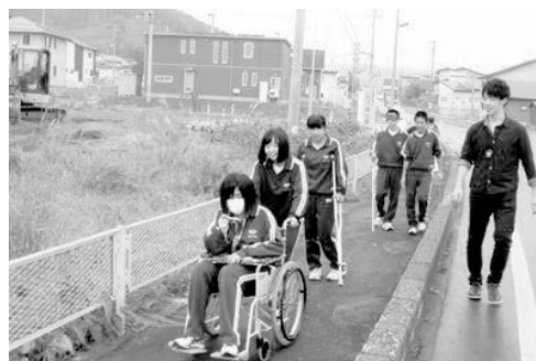
写真3 災害時要援護者体験

3年生に対しては、実際に車いすや松葉杖、全盲体験装置などを身につけ、災害時要援護者体験を実施した。この際、災害時要援護者の避難に支障をきたすと思われるポイントを地図上にマーキングさせ、最終的に災害時要援護者の避難支援マップとしてとりまとめさせた。また、地域の町内会長等、住民にも参加を依頼し、異世代間交流も促進させた。