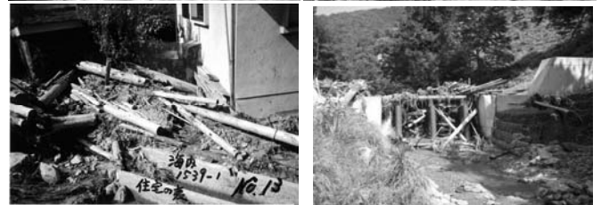
写真-3 溪流周辺の流木による被害拡大と施設効果の状況