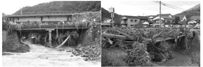
写真-2 流木による河道の閉塞状況