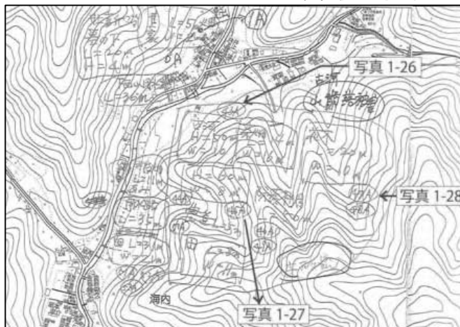
図-2 地域住民が行った災害直後の調査図面（一部抜粋）

佐用町においては、町中心部の洪水被害が甚大であったことなどから、上流域では行政による直後の災害対応が十分に行えなかったようである。そこで地域（住民）は、佐用町役場からの依頼もあり、自らが実施可能な災害復旧（土砂・流木等の除去によるライフラインの確保）や、二次災害に備えた溪流や流域の被害状況調査を行っている。これらの行動が実際の災害地（佐用町）で行えたのは、次の理由が考えられる。