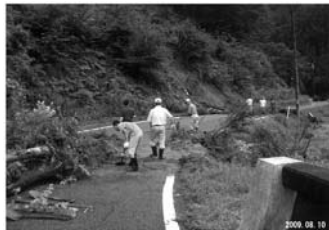
写真-4 地域住民による災害直後の対応状況

図-2は、調査時に用いられた手書きの記載が入った図面である。斜面の崩壊状況や道路の決壊状況、土砂の堆積状況等のメモ（寸法：幅や長さ等）が記入されている。写真-4は住民による道路復旧の状況である。