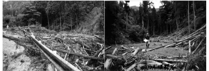
写真-1 上流域(流木発生域)の溪流の状況

上流域には、今回の災害で流出しなかった土砂と多量の流木が確認できる場所が多数あり、二次移動による再度災害が懸念される。河道の閉塞地点やその付近には、H16 年災害の風倒木を現地で処理したものと考えられる玉切りされた流木が多数確認できる。また、橋梁やわん曲部などでの流木による河道の閉塞により、洪水流や流出土砂（流木を含む）は溪流周辺に溢れ、流木が広範囲に到達するなど、被害を拡大していることが分かる。