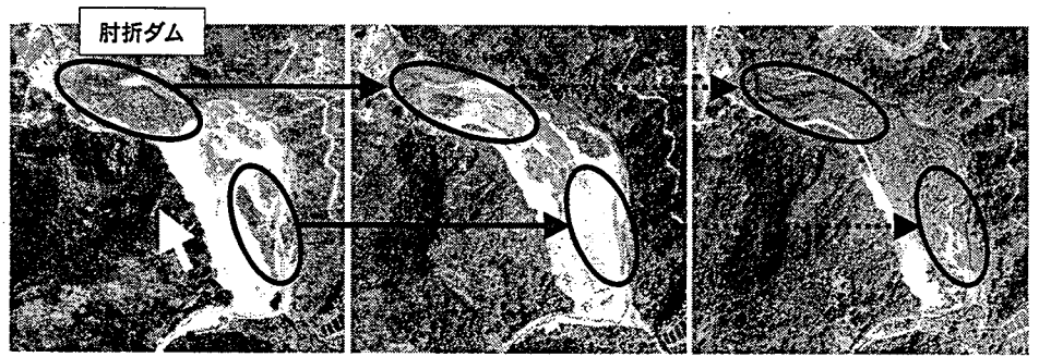
写真-1 肘折ダム (写真上が北, 写真-2, 3も同様)

【参考文献】 厚井高志・堀田紀文・鈴木雅一 (2005): 最上川流域における砂防堰堤堆砂地への植生侵入の実態と侵入時期に関わる要因の検討, 砂防学会誌, 投稿中 山形県土木部砂防課・国土交通省東北地方整備局新庄河川事務所・同福島河川国道事務所・同北陸地方整備局飯豊山系砂防事務所 (2003): 山形県の土砂災害, p.19