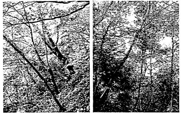
図2 東南稜斜面における樹林の状況

植生調査結果から、No.2（自然性二次林）の階層構造の分化と植物種数が40種という全調査地点内では最大の値を確認した。施工区では、No.6（S60）のヤマハンノキ群落で33種、以下、No.4（S62）24種、No.1（H3）と続き、No.3（H1）のイロハモミジ・ニシキウツギ群落も26種と比較的多い。各施工区のうち、施工後の時間経過が短い地点では8種～19種とばらつくものの植物種数が少なく、No.8（H11）やNo.9（H9）のように階段工で草原になっている箇所ではシカの食害が観察された。工種ごとにみると、鋼製柵工で階段状に施工した地点におけるヤマハンノキ群落の成長がよく、自然性二次林と比べても遜色なかった。