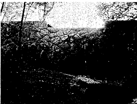
写真-3 一の谷えん堤