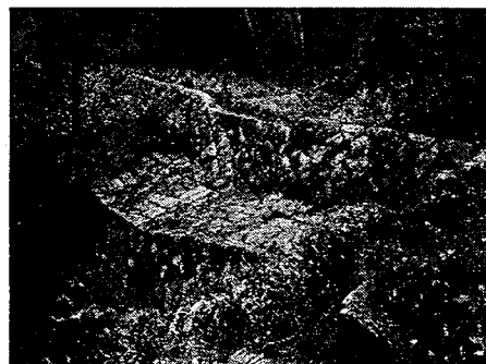
写真-4 土佐ヶ谷2号谷止