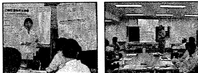
各グループの発表者による発表の様子

ワークショップの結果については、各グループで発表者を決め、議論の結果をまとめて発表する形にした。