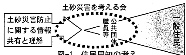
図-1 住民周知の考え

住民意識調査の結果から、住民が求めている基礎的な情報および身近な情報の周知を積極的に推進していくため、効果が期待できるワークショップの手法を用いた土砂災害を考える会を実施した。今回の対象は、今後の周知活動を担う行政職員とし、その関心・知識を高めるとともに、周知活動の課題の抽出、ワークショップ手法の有効性を検証することを目的とした。