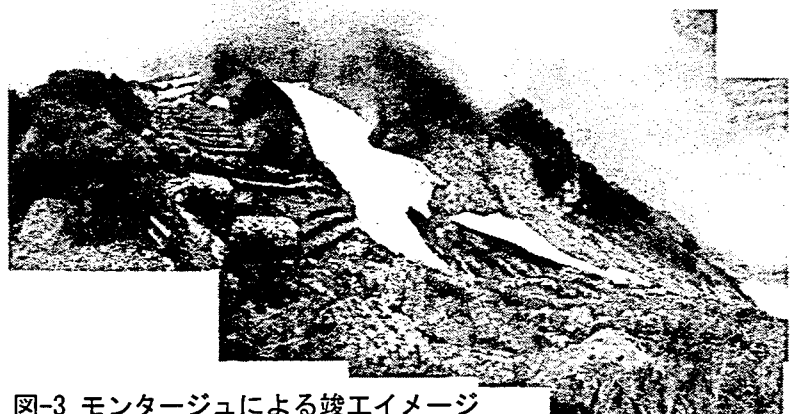
図-3 モンターージュによる竣工イメージ

本対策工法は，高標高地の土砂生産源対策として一定の効果発揮しつつあり，今後の類似した環境で実施される砂防事業の一事例として参考にされることを望む次第である．