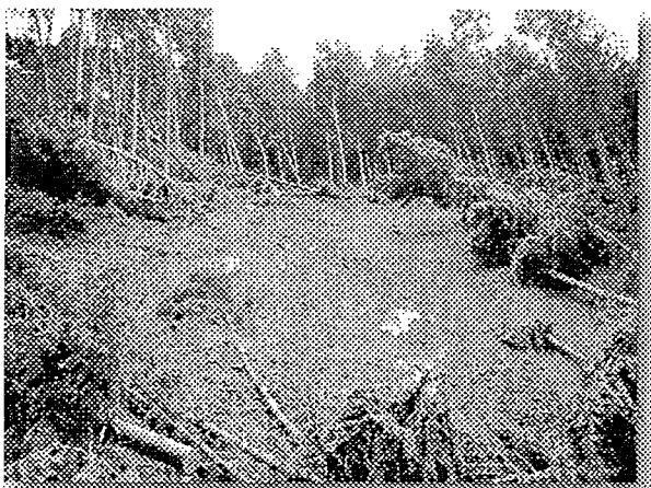
写真1 風倒木と表層崩壊の例 (福岡県篠栗町)

平成 16 年は太平洋高気圧が北へ偏ったため、台風の発生数は 29 個と平年並みにもかかわらず、日本への上陸台風数 10 個(九州地方接近上陸数も 10 個)と平年の 1.2 個の 10 倍近くに上った。九州地方においても、台風 18 号の強風では大分県日田地方に倒木の被害が目立ったが、福岡県篠栗町の演習林では 10 月の大型台風 23 号の風倒木への影響が大きく、相当の倒木とそれに伴う崩壊があった。ここでは、これら倒木に伴う表層崩壊の発生機構の分析を行ったので報告する。