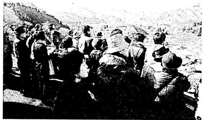
図2 肘折カルデラを目前に説明を受けるセミナー参加者