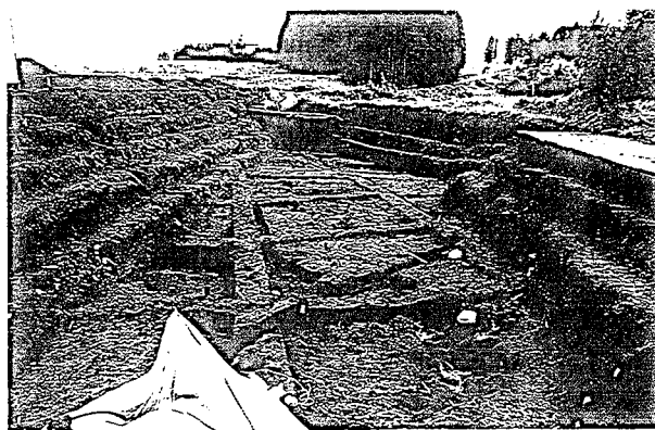
Photo 1. Excavation in the Kawayo F remains.

調査地域周辺は縄文~弥生時代の遺物が多数出土することが知られており、今回発掘が実施された河陽 F 遺跡もその一つである。発掘調査は 2000 年 7 月より 1 区 (北側: 約 1,000 m 2 ) と 2 区 (南側: 約 100 m 2 ) において行われた。調査 2 区は長さ 27 m, 最大幅 7 m, 深さ 3 m 程度と小規模なものであり、縄文時代草創期~晩期 (約 12,000~2,500 年前) の遺物・遺構が確認された。一方、調査 1 区は長さ 100 m, 最大幅 17 m, 深さ 3 m 程度にわたって調査が行われ、火山碎屑物からなる堆積物に埋没する弥生時代中期~後期 (約 2,000~1,800 年前) の遺物や遺構が発見された (Photo 1)。また堆積物の上層からは古墳時代後期 (約 1,500~1,450 年前)~近世 (約 150 年前) の遺物や遺構が確認されている。さらに調査 1 区の南端約 20 m 2 からは、縄文時代草創期~早期 (約 12,000~8,000 年前) の土器や石器が出土している。