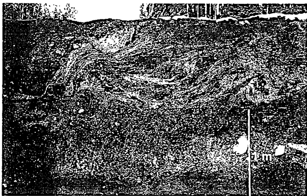
Photo 2. A Volcaniclastic deposit including deformed loamy blocks in the remains.

この堆積物は、かつて斜面に存在していた火山灰層や土壌層からなる塊(以下、ブロックと呼ぶ)を多量に含むことが特徴である(Photo 2)。ブロック間を埋めるマトリックスは細粒粒子(粘土～シルト)を主体としているが、非常に淘汰が悪い。ブロックは著しく変形を受けているとともに、その一部が流動中に分裂した形跡も認められた。