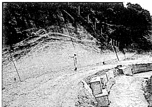
写真-1 土砂流および流木の流下痕跡

流木を含んだ土砂流の流下痕跡は、荒谷川中流域の曲流部に隣接するコンクリート擁壁にて最も明瞭に観察された。当該箇所の平均河床勾配は 1/20、氾濫時の流下幅は 8 m、水路の曲率半径は約 30m であった。コンクリート表面のうち土砂流の影響を受けた部分は等しく摩擦し、また流木に摩擦された部分は白く引っ掻いたような摩擦痕が連続的に残されていた（写真-1）。このそれぞれの流下痕跡の高さを、曲流部から直線部にかけて連続的に計測したところ、直線部では土砂流によって摩擦を受けた部分が約 1.2m、そこから流木の摩擦痕の上端までが約 0.5m であったのに対し、曲流部の外湾側では土砂流によって摩擦を受けた部分が約 1.5 m、流木の摩擦痕の上端までが最大 2.0m であった。なお、曲流部の内湾側には流木の摩擦痕は確認できなかった。ここで、直線部での水深を 1.2m、流路幅を 8 m、平均流速を 5 m/s、水路の曲率半径を 30m と仮定して、土石流対策技術指針（案）に示される土石流の外湾部の水位を求める式 2) を用いてこれを算出したところ、外湾部での水位は 2.6m となり、土砂流によって摩擦を受けた部分の高さ（1.5m）よりも大きな値となった。