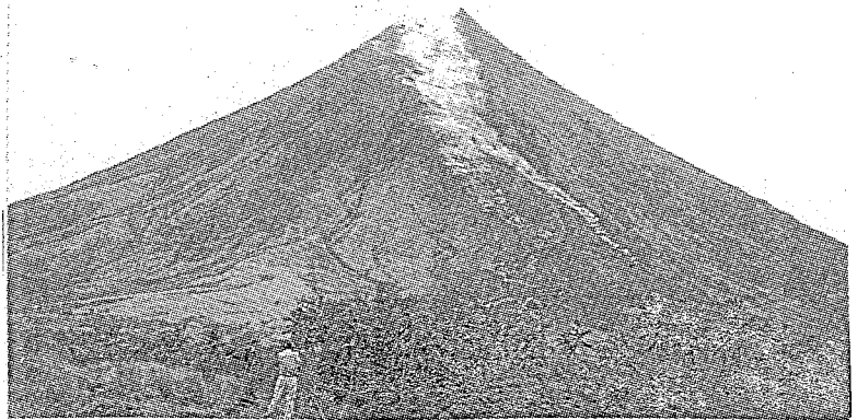
写真-1 降雨後のマヨン火山南麓(3月27日)