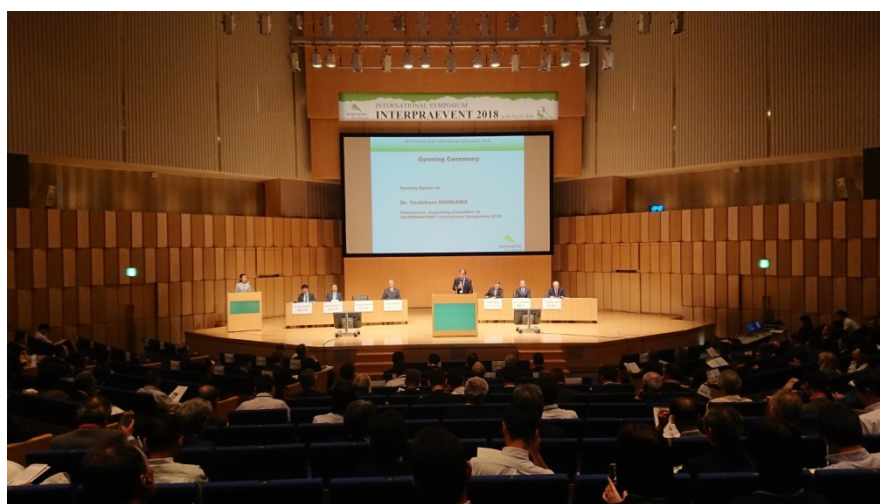
INTERPRAEVENT2018オープニングセレモニー

平成30年10月1～4日に、富山県富山市の富山国際会議場において開催中の土砂災害に関する国際学会「INTERPRAEVENT2018」において、砂防学会平成30年北海道胆振東部地震土砂災害緊急調査団の調査結果について、ポスター掲示による情報提供を行っています。